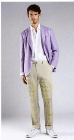
À gauche : chinos Hackett. À droite : pantalon en gabardine de coton Incotex.