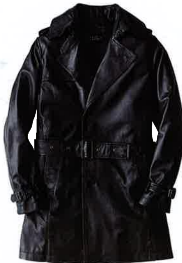
06 バーニーズ ニューヨーク BARNEYS NEW YORK

ちょいタイトで着丈短めな絶妙なサイジングと立体的なフードが実にモダンな雰囲気醸す、LA発のブランドからのダブルコート。ネイビーとチェックのダブルフェイスの生地も、厚手ながら軽く柔らか。スコットランド製で本格的作りもポイント。4万9350円/スウィープ!! (バーニーズ ニューヨーク)