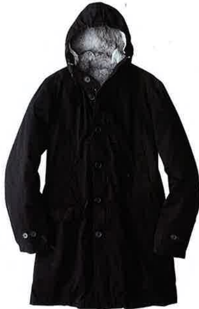
03 マルコ タリアフェリ MARCOTAGLIAFERRI

20世紀初頭にヨットマンのためのブランドとして生まれたマイティ マック。そんなタフアウターの名門にミリタリーの定番N-3Bを別注。本格仕様の一着ながら、タイトかつ着丈ちょい長めのフォルムゆえ、スタイリッシュにこなせます。6万9300円/マイティ マック (バーニーズ ニューヨーク)