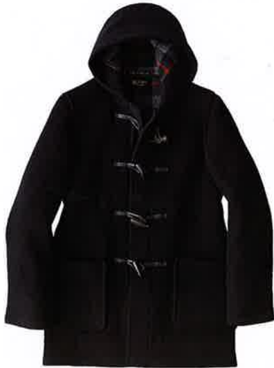
07 スウィープ!! SWEEP!!