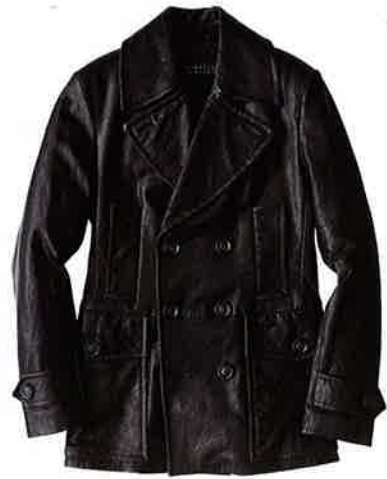
05 バーニーズ ニューヨーク BARNEYS NEW YORK

チンストラップやエポーレットなど本格仕様のディテールを備えながらも、さらりと羽織れるシングルブレストに仕立てられたレザートレンチ。しなやかなシープレザーの質感&身体のラインに寄り添うフォルムがエレガント。12万6000円/バーニーズ ニューヨーク (バーニーズ ニューヨーク)