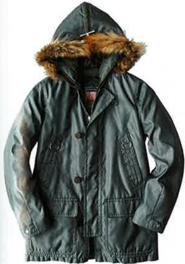
04 マイティ マック MIGHTY MAC

昨年来LEONで注目しておりましたタフアウターも、今季はさらに進化発展しています。プルゾンあり、ちょいシックなコートあり…、素材もレザーやコットン、ナイロンからゴアテックスまで多種多様。で、特有の無骨さを、気張りではなくオトコの色気に変えるためにも、ライダーズ同様こなしはシックに、が大人の方程式です。